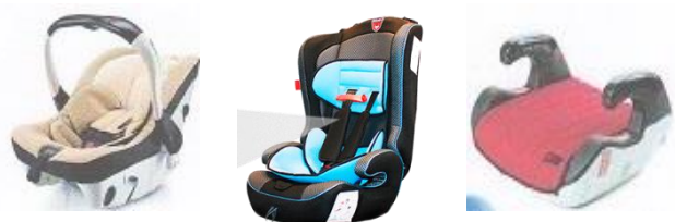
Автолюлька Автокресло Бустер